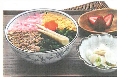
メニューA 春の彩り そばろ弁当 (ベジ軽弁当)