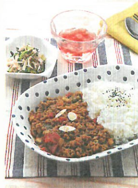
メニューB 夏のスパイシー弁当 (ベジ充弁当)