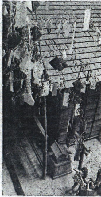
江戸時代の七夕飾りを再現した展示 (4日、江東区の深川江戸資料館で)

江東支局 〒130-0022 墨田区江東橋 2 の13の4 錦糸町シティビル 電話 03(3631)6116 FAX 03(3632)2530 koto@yomiuri.com 都内版編集室 電話03(3217)1465・1466 武蔵野支局 電話0422(51)3131 立川支局 電話042(523)4477 ホームページ http://www.yomiuri.co.jp/local/